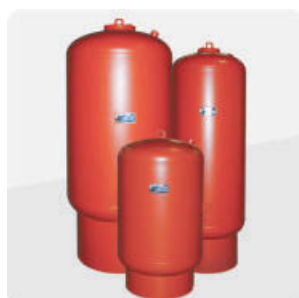
Serie Well-X-Trol ASME