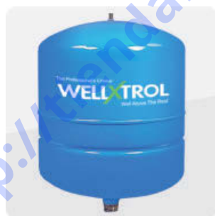
Serie Well-X-Trol Tuf-Kote