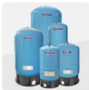
Serie water pro